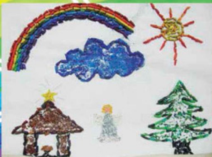
Gabriel Neiverth - 6 anos

com as famílias para a entrega do prêmio. Agradecemos aos participantes! Todos os desenhos serão publicados no site da Editora Concórdia e no portal da IELB.