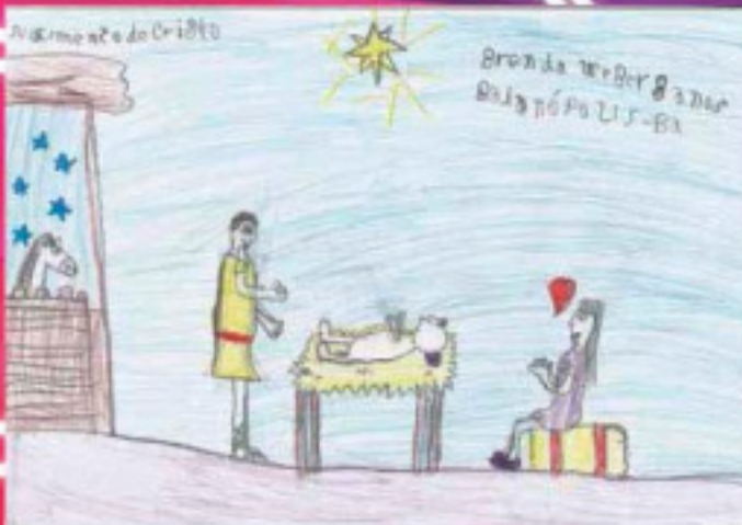
Brenda Weber - 8 anos