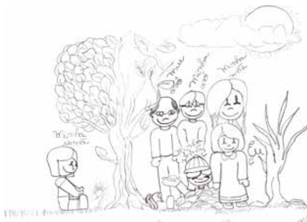
Isabella Szaucoski, 9 anos - Ponta Gros- sa, PR