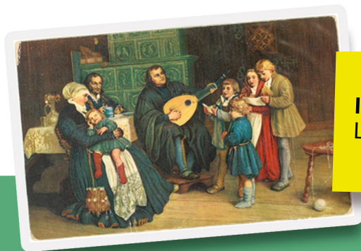
Lutero e família.

Os ensinamentos de Lutero se espalharam por toda a Europa e para todo o mundo. Martinho Lutero baseou toda sua obra na leitura e estudo da palavra de Deus. Aos 62 anos morreu confessando a fé no Salvador do mundo, Jesus Cristo pelo qual dedicou toda sua vida.